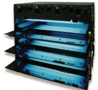
■参考例 (写真は三段仕様) 三段仕様、蛍光灯の本数など各種オーダーメイド承ります。