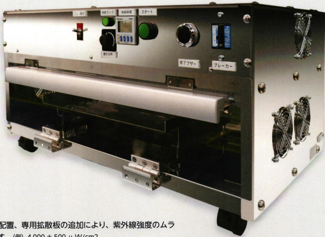
蛍光灯の配置、専用拡散板の追加により、紫外線強度のムラを抑えます。(例) 4,000 \pm 500 \mu W/cm^2

独自インバーター制御による高出力 (MAX130%) を誇る為、外部昇圧機が不要です。高効率な空気取り込みを行う構造の為、温度上昇を効率良く抑制出来ます。UV反射率の優れた反射板を使用し、理想的な配光を実現しております。小スペース用小型機、段数等の特殊仕様にも対応可能です。